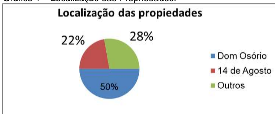
Gráfico 1 – Localização das Propriedades.

A avicultura alternativa é considerada uma opção viável para a diversificação da renda na agricultura familiar, pois além da demanda crescente por frangos e ovos do tipo caipira nos mercados, a atividade é facilmente assimilada pela maioria das famílias agricultoras, inclusive por aquelas que têm restrições em termos de área para sustentar criações de espécies de maior porte.