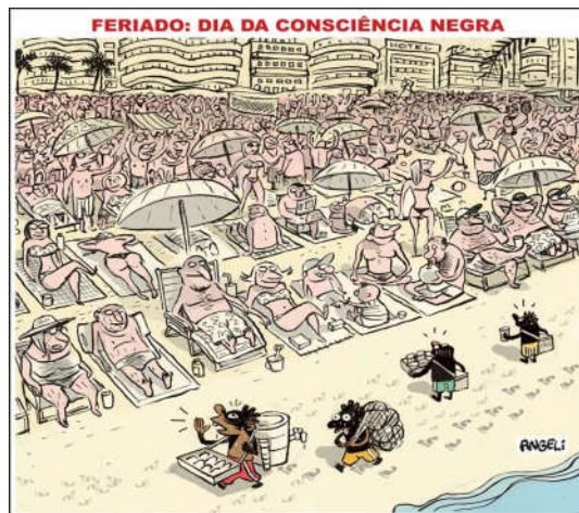
Figura 2 – Charge. Autor: Angeli.

foram passadas aos grupos, a saber: “Compare as diferenças entre negros e brancos no Brasil e nos Estados Unidos. O que diziam as leis desses países sobre a convivência entre negros e brancos?” e “Observe a charge na página 288 do livro (Ver Figura 2). Explique a contradição que o desenhista tentou expor”. Os grupos podiam pesquisar no livro didático: “Tempos modernos, tempos de sociologia” (BOMENY et al , 2013), mais especificamente no capítulo 18: “desigualdades de várias ordens”. As respostas do grupo deveriam ser escritas numa folha e repassada ao professor.